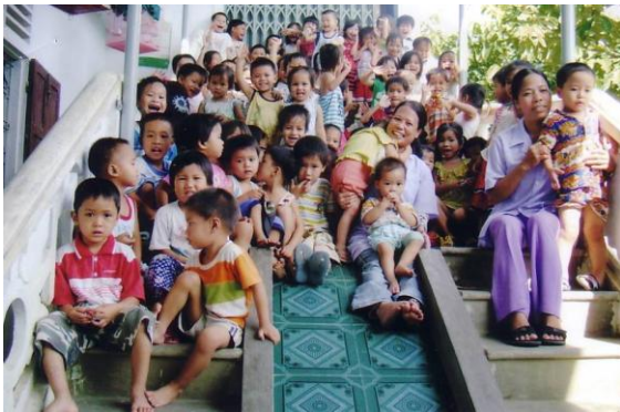
Nhà Trẻ làng Triều Sơn Nam, Huế

“Con cảm ơn quý Hội đã giúp con tiền bạc trong năm vừa qua. Với số tiền đó con đóng lệ phí trường, mua sách vở và mua tài liệu ôn thi. Nếu qua được kỳ thi tốt nghiệp này, con dự định sẽ đi thi đại học. Con sẽ cố gắng học tập để sau này trở thành người có ích cho gia đình và xã hội.”