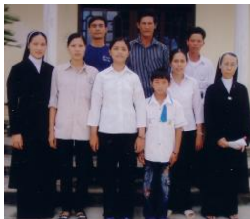
Bốn học sinh và phụ huynh ở Nghệ An, Vinh bên cạnh các Nữ Tu thường khuyển khích giúp đỡ.

“Em thật xúc động và rất cảm kích trước những tấm gương như các anh chị. Em nghe kể anh chị làm việc rất vất vả, và chính những đồng tiền em đang được anh chị giúp là những gì là mồ hôi nước mắt của anh chị đã đổ ra cho chúng em. Mặc dù anh chị chưa một lần biết nhiều về chúng em, nhưng các anh chị đã giúp đỡ chúng em không một chút ngần ngại và cũng không mong muốn trong sự trả công ở đời này mà tích công trạng cho đời sau. Vì những điều đó, em hứa sẽ cố gắng học tập thật tốt để đền đáp công ơn các anh chị. Những lúc này em không có lời gì để nói lên tâm sự tình cảm của em đối với các anh chị, mà em chỉ biết nói lời cảm ơn, cảm ơn...tới anh chị mà thôi. Em thật là may mắn và hạnh phúc khi được sinh ra trong môi trường bác ái và tràn đầy yêu thương này. Chính vì những lẽ đó em chắc chắn khi mà em trưởng thành cũng sẽ noi gương các anh chị làm những việc có ích cho giáo hội và cho xã hội. Em cũng ước mơ được đi tu góp công sức nhỏ nhoi của mình vào việc xây dựng giáo hội. Ngay từ đầu năm học này em đã được các anh chị giúp đỡ về vật chất và tinh thần. Đây là những gì quan trọng và quý giá đối với em. Nó sẽ giúp em vượt qua khó khăn trong cuộc sống để bắt đầu năm học mới.”