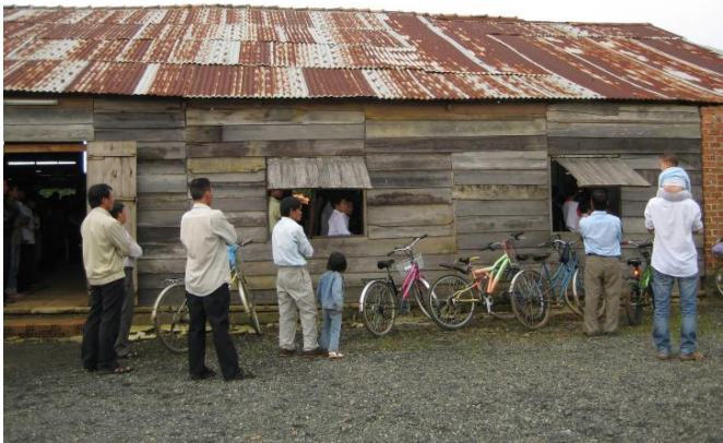
Nhà Thờ Suối Mơ

Vì cha chánh xứ nhà thờ Suối Mơ sắp cử hành thánh lễ, chúng tôi chỉ có dịp hỏi thăm Ngài vài phút. Tuy nhiên, nhìn lớp học tường tre mái lá, chắc chắn sẽ không tồn tại được lâu. Ước mong chúng ta góp tay để cha có phương tiện xây lên những lớp học vững chắc hơn cho các em.