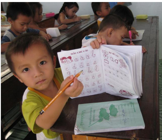
Lớp học Tình Thương, Suối Tiên