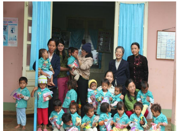
Nhà Trẻ Tà Nung.