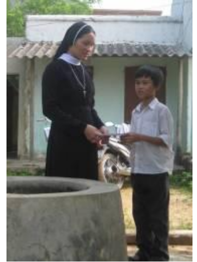
Một em ở Nghệ An đang nhận học bổng

Đi học là niềm mơ ước của biết bao bạn trẻ và con cũng có niềm mơ ước đó, cũng muốn được đi học được vui chơi, được sống trong tiếng cười của bè bạn để mở mang tầm hiểu biết và để trở thành người hữu ích. Sinh ra trong một gia đình nông dân nghèo, nhiều anh chị em đi học, để cấp cho anh chị em con ăn học, cha mẹ đã phải vất vả biết bao. Nhờ sự giúp đỡ, quan tâm của quý Hội, năm học mới này con lại có thêm nghị lực để tiến bước. Số tiền ba triệu đồng này không chỉ là món quà vật chất mà còn là món quà tinh thần rất lớn đối với con và gia đình con. Nó đã khích lệ con rất nhiều.