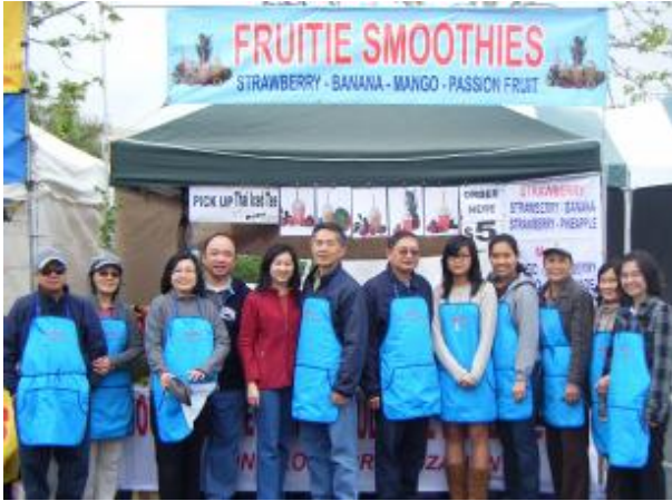
Rancho Palos Verdes