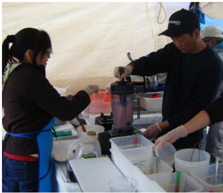
Redondo Beach & Manhattan Beach