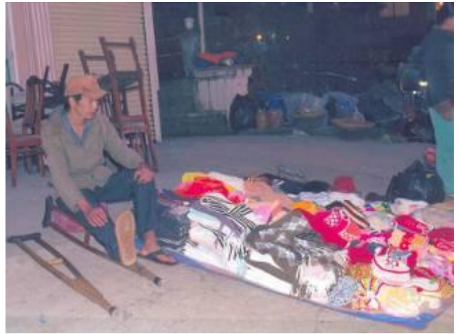
Hình trên: em sinh viên TQD, Đà Lạt, bị liệt chân do tai nạn, ban đêm đi làm thêm để kiếm tiền đóng học phí.

Tôi rất cảm kích trước tấm lòng của quý ban hội SBVCC đã giúp đỡ cho con tôi được đến trường tốt trong năm học trước, cũng tốt đẹp, và năm nay quý hội cũng đã giúp đỡ cho con tôi với số tiền là 1000.000 VNĐ. Tôi rất cảm ơn và phần khởi khi có quý hội quan tâm và giúp đỡ để con tôi học hành tốt hơn, Tôi xin thành biết ơn và cảm ơn quý hội và chúc quý hội được khỏe mạnh thịnh vượng và vạn sự như ý. Đà Lạt ngày 31-7-2011 Tô Văn Tuấn