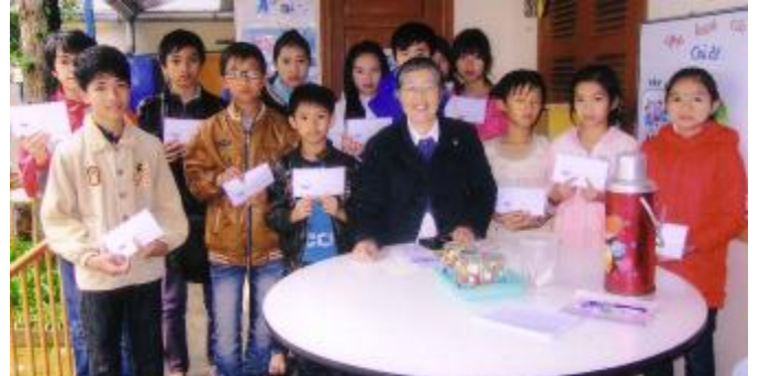
Hình dưới: các em Đà Lạt nhận học bổng